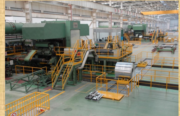
Rolling of Aluminium