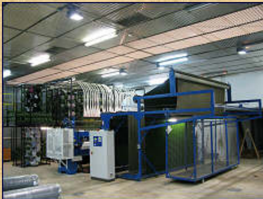
Wall to Wall Tufting