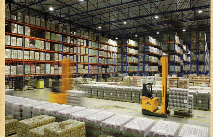
Logistics 3 PL / 4 PL